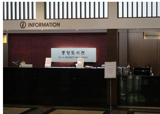
[ 중앙도서관 1층 인포메이션 센터 ]