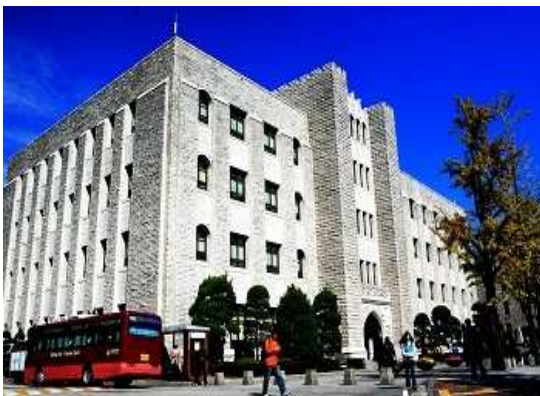
[ 중앙도서관 ]